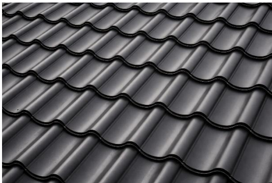
Alu- oder Blecheindeckung mit Pfannenprägung auf Vollschalung