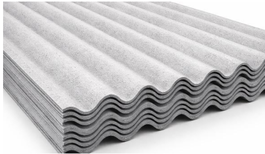
Betonwellplatten / astbestfrei