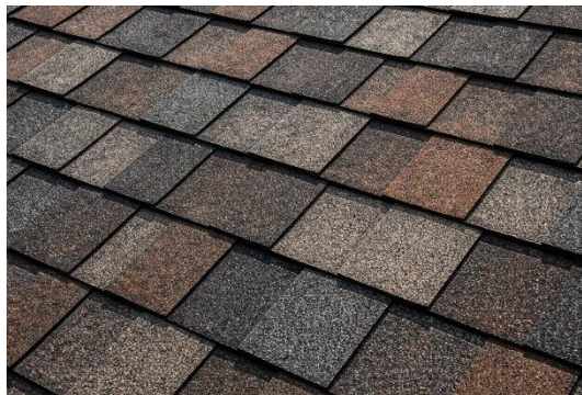
Bitumenschindeln auf Vollschalung

* Wir verpflichten uns, die folgenden Auflagen einzuhalten: